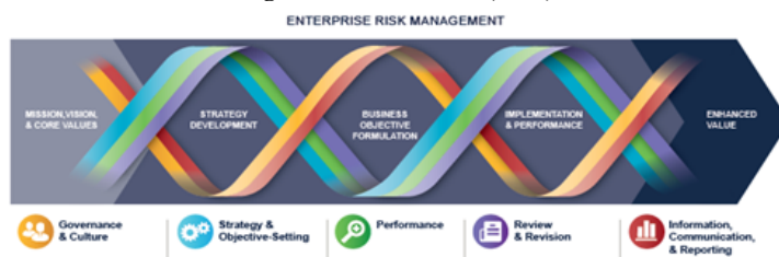
Figura 2: COSO-ERM (2017)

Quanto aos questionamentos presentes no QACI, estes foram elaborados com base no framework COSO - ERM (2017), constante de Figura 1 abaixo.