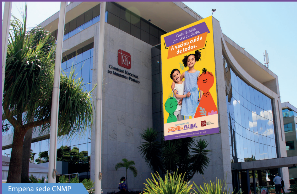
Empena sede CNMP