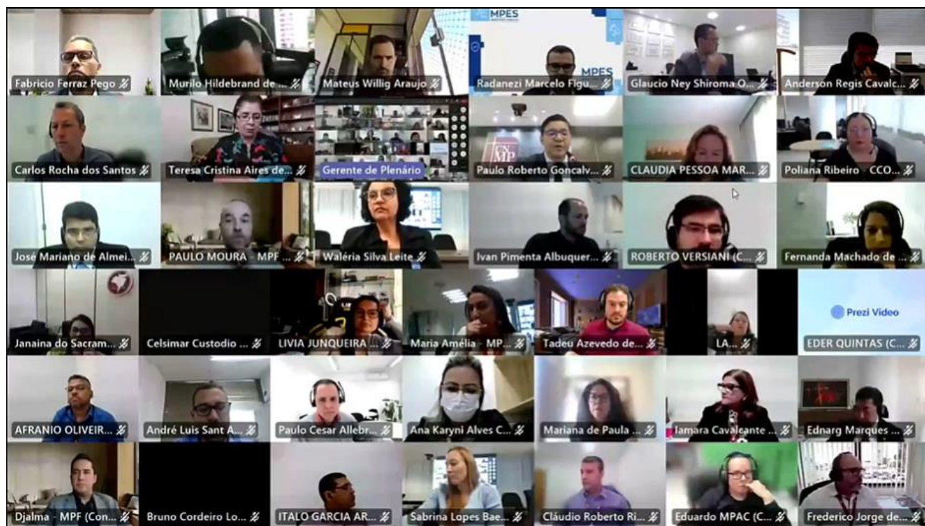
Plenária de abertura

https://www.cnmp.mp.br/portal/todas-as-noticias/15915-integrantes-do-forum-nacional-de-gestao-do-ministerio-publico-se-reunem-para-elaborar-plano-de-trabalho-dos-proximos-tres-anos-2