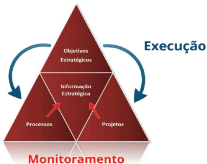
Figura 2 – Modelo de Gestão Estratégica

O alcance desses objetivos depende da alocação de recursos humanos, materiais e financeiros, ao longo do tempo, para a execução de projetos e processos. Tais iniciativas devem ser permanentemente monitoradas por meio de indicadores que permitam mensurar sua contribuição para o alcance das metas traçadas e orientar ajustes de percurso eventualmente necessários (figura 2).