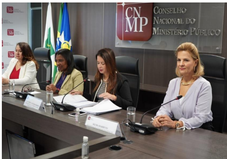
Reunião da Rede de Ouvidorias