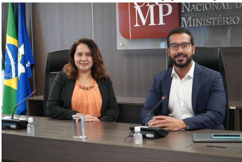
2º Evento Diálogos sobre Ouvidoria: Atendimento a Pessoas com Transtornos Mentais

O referido evento trouxe uma breve reflexão acerca do papel desempenhado pelas ouvidorias públicas no que diz respeito ao atendimento humanizado, abordando e propondo técnicas eficazes no atendimento à comunidade com transtornos mentais.