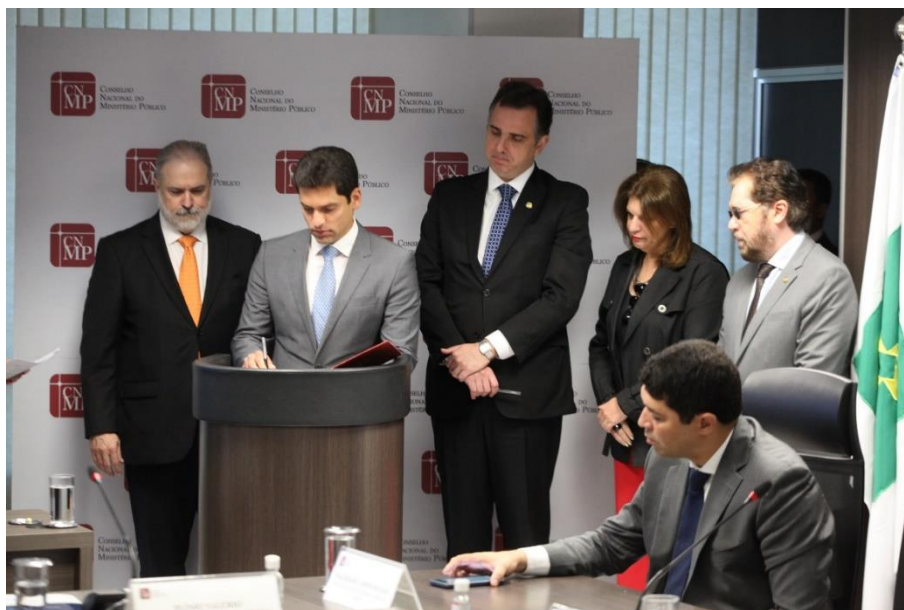
Reunião de Assinatura de Acordo de Cooperação Técnica entre Conselho Nacional do Ministério Público e Senado Federal.