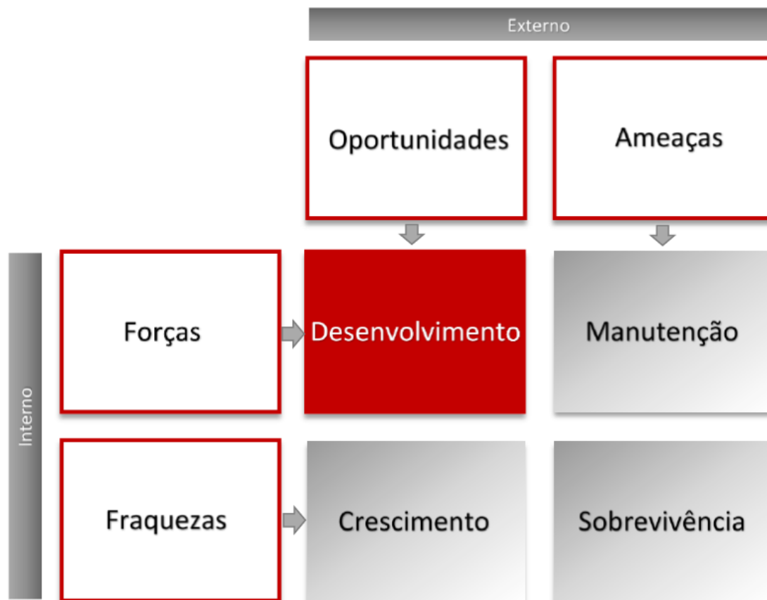
Figura 4 – Resultado SWOT COGP

que torna a estratégia de desenvolvimento como a mais adequada para a COGP, segundo a metodologia.