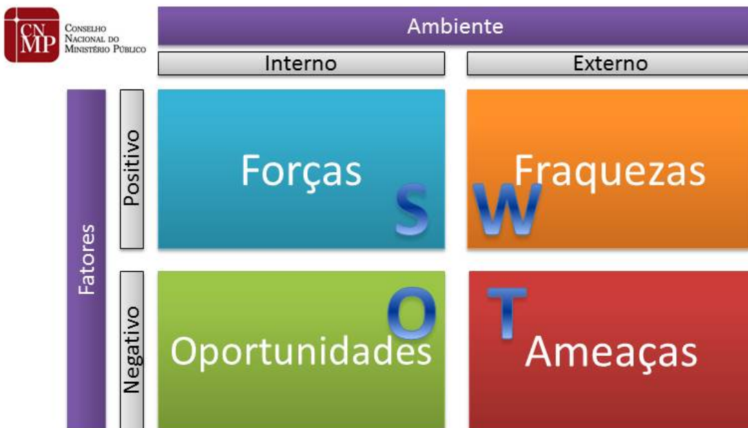
Figura 3 – Exemplo de Matriz SWOT