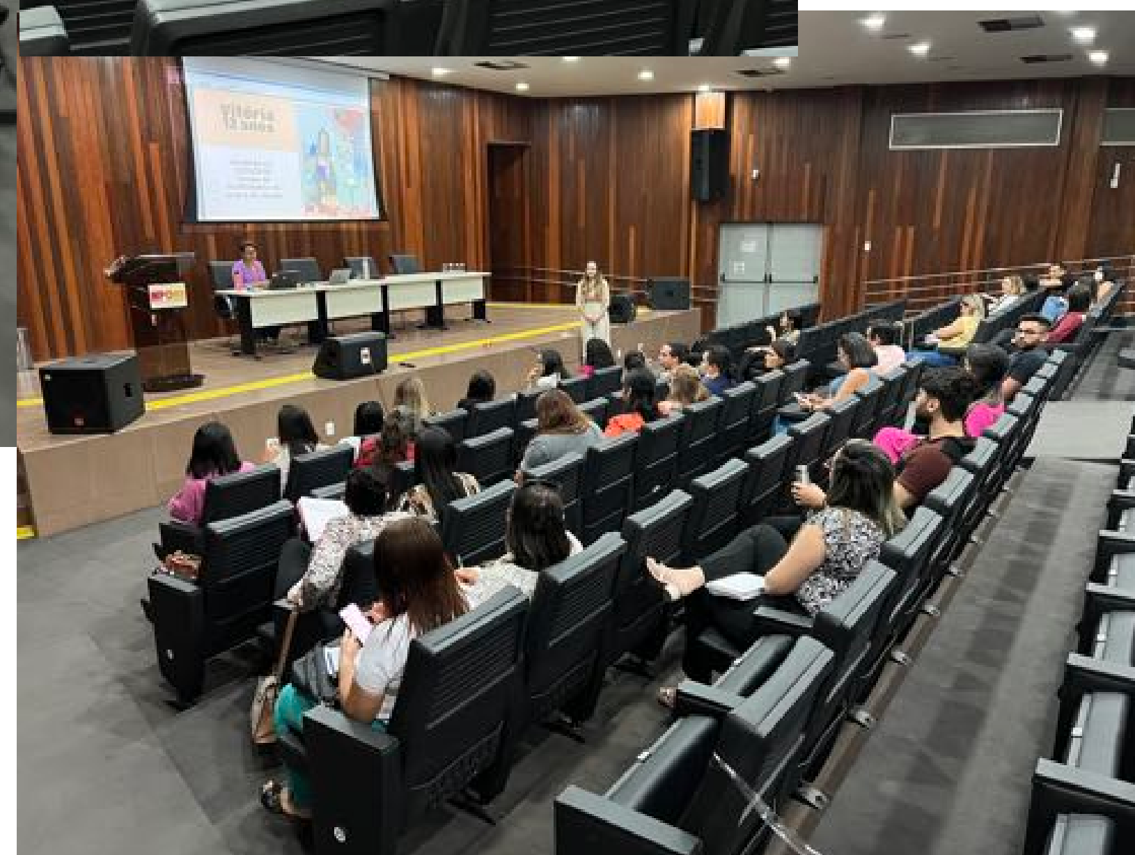
Inspeções Concentradas da Semana Passada (Setembro 2022)