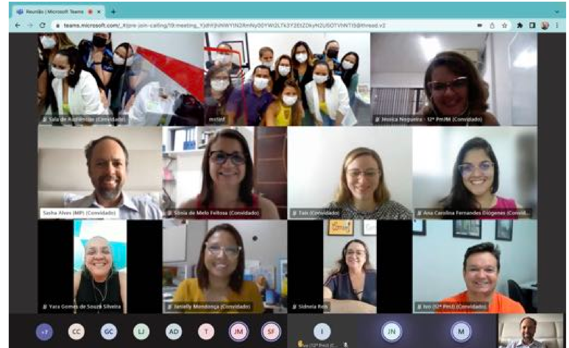
Audiências concentradas - Abril de 2022