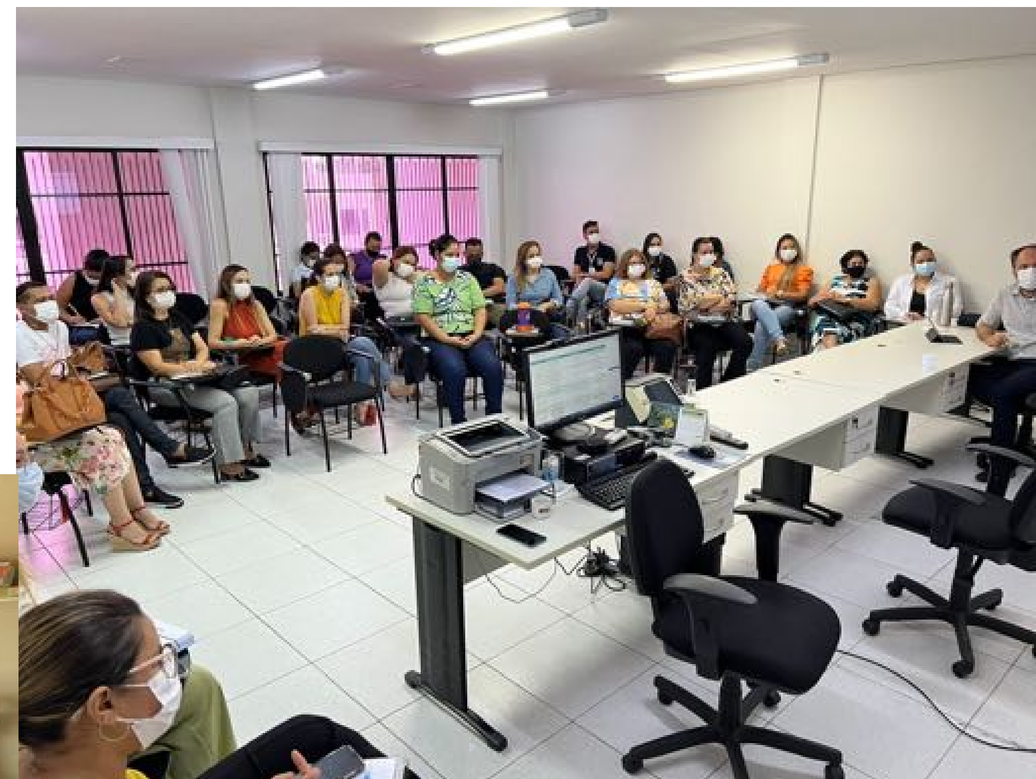
Inspeção concentrada do MP com a rede de proteção de Mossoró - Abril de 2022