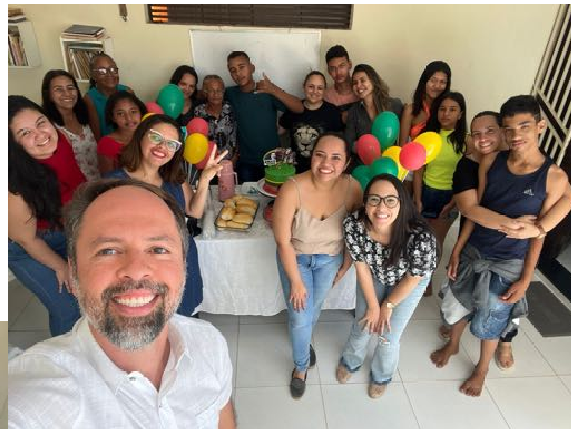
Visita da equipe do MP ao NIAC, Aldeias e AIA - Agosto de 2022