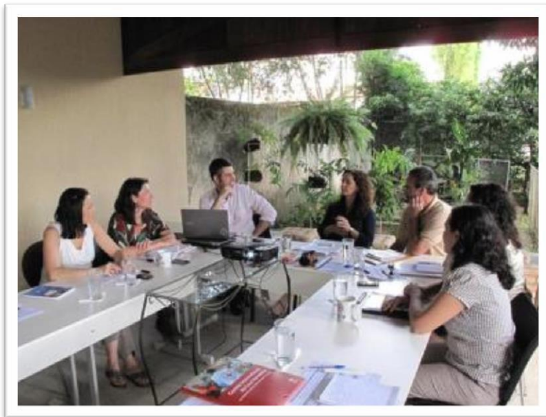
Programa de Imersão Estratégica com gestores de comunicação para a América Latina do Comitê Internacional da Cruz Vermelha - MAI/13