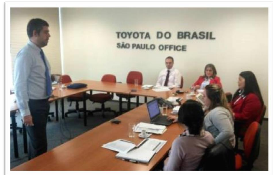
Workshop Estratégico para a liderança de Marketing Digital da Toyota do Brasil - JUN/13