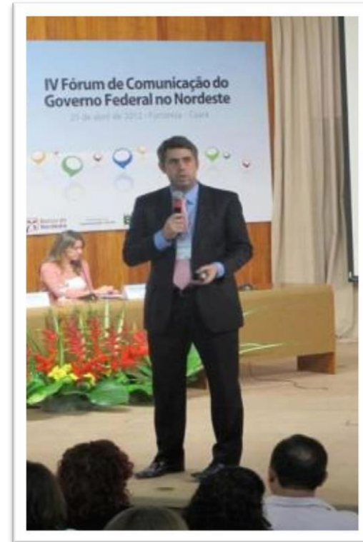
Palestra sobre Gestão de e-Crises em evento promovido pelo Banco do Nordeste (BNB) - ABR/12