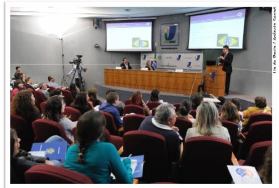
Palestra no Senado Federal sobre Comunicação Digital e os Impactos na Sociedade e nas Organizações - SET/12