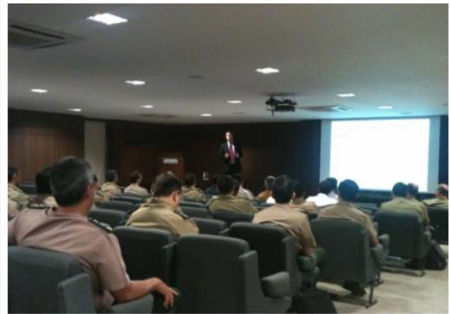
Palestra para Quadro do Estado Maior do Exército Brasileiro sobre a “O poder da Internet e das Mídias Sociais na Comunicação” - JUL/12