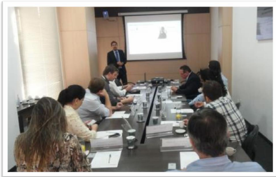
Palestra de Gestão Estratégica com Facebook Ads, Adwords e Google Analytics na AMCHAM/SP – JUN/13