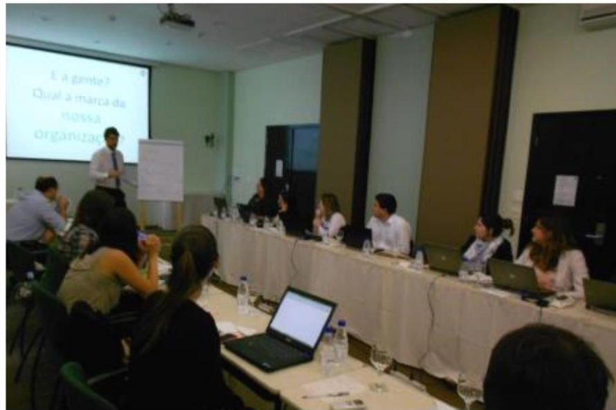
Workshop de Estratégias de Marketing Digital na Dupont/SP – 2011 e 2012